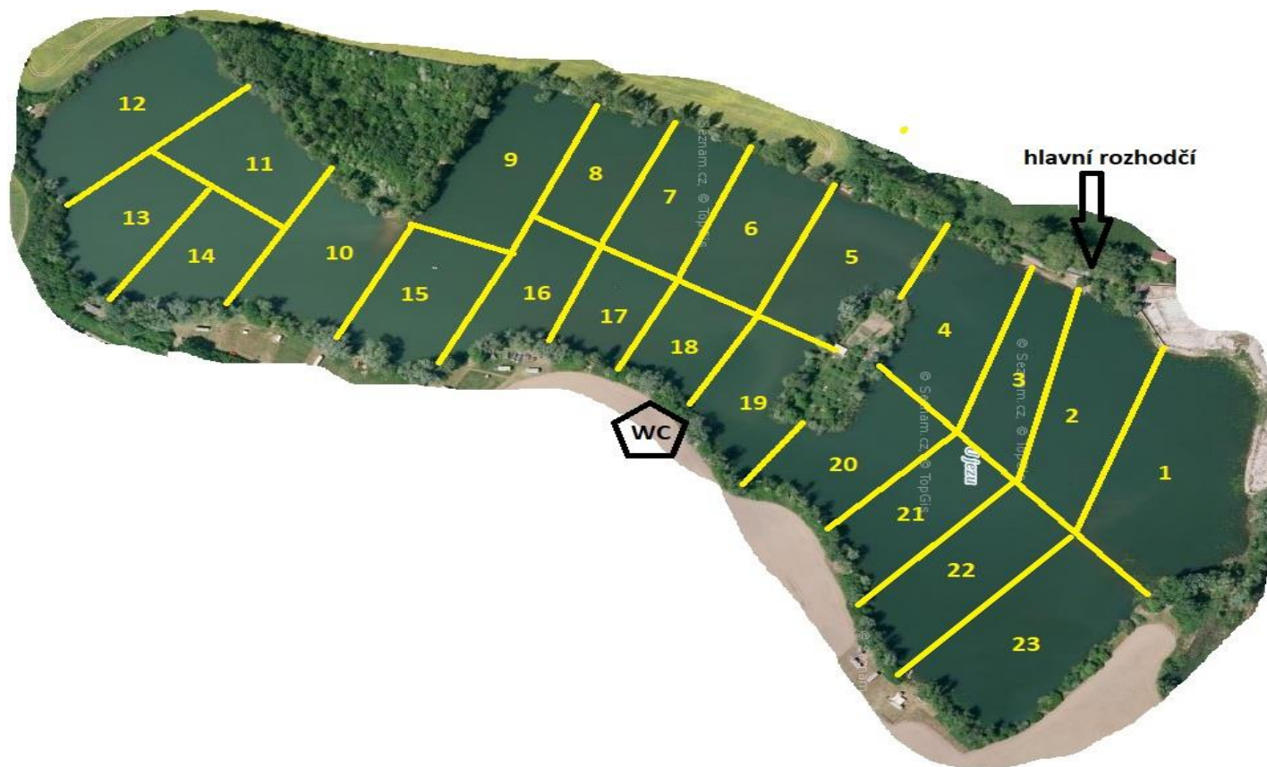
Obr. 1: Mapa lovného úseku U jezu se zakreslením a označením jednotlivých lovných sektorů.