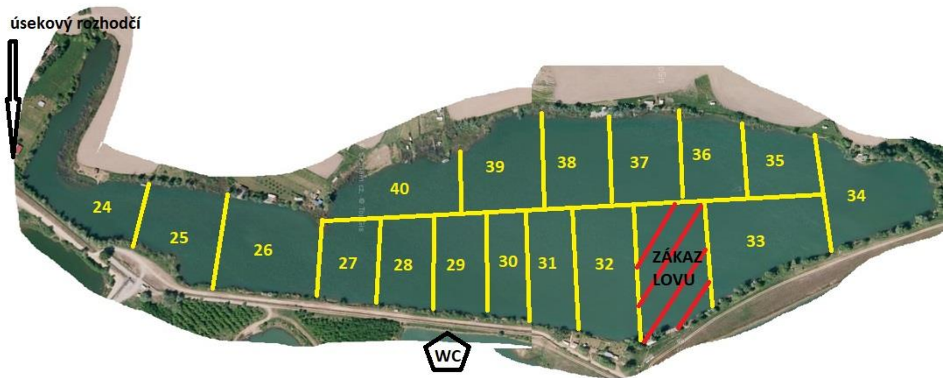
Obr. 2: Mapa lovného úseku Bezedné se zakreslením a označením jednotlivých lovných sektorů.