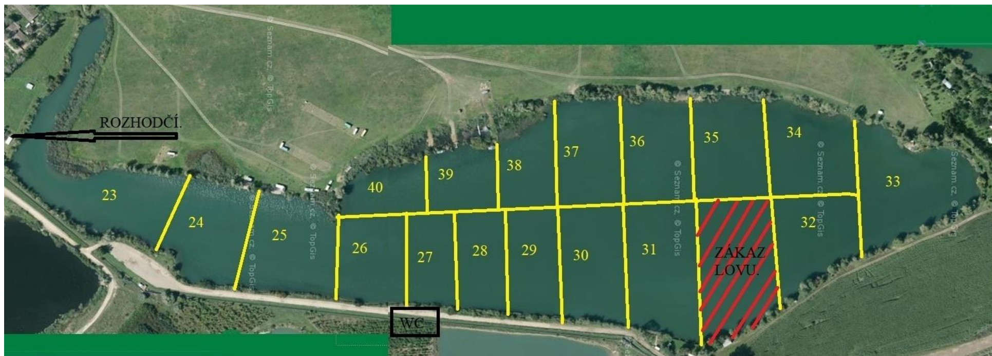
Obr. 2: Mapa lovného úseku Bezedné se zakreslením a označením jednotlivých lovných sektorů.